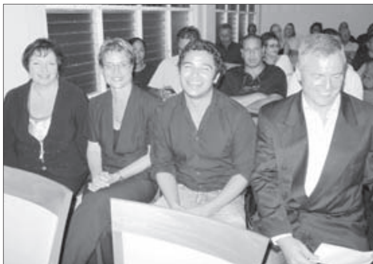
Staff di OGM di Facultad di Arte y Ciencia

Den e caso aki na Hulanda, futbol por yuda trece hendenan cu ta sinti nan mes marginalisa atrobe den sociedad, pa nan sinti nan mes cu nan ta pertenece den e sociedad. "Y esaki ta contribui na un imagen propio y ta duna conocemento, comprension di regla y implementacion di regla pa logra obhetivonan." Segun e decano di FAS, normalmente un hende ta siña e abilidadnan aki pa medio di educacion na